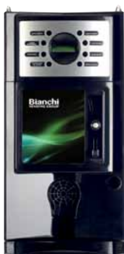
GAIA CON KIT INTRODUZIONE MONETA